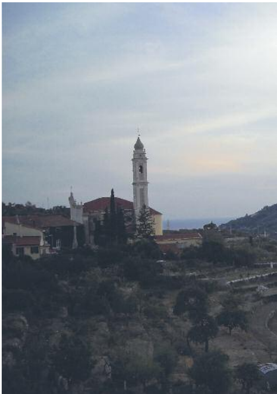
Veduta della campagna di Costa d'Oneglia.