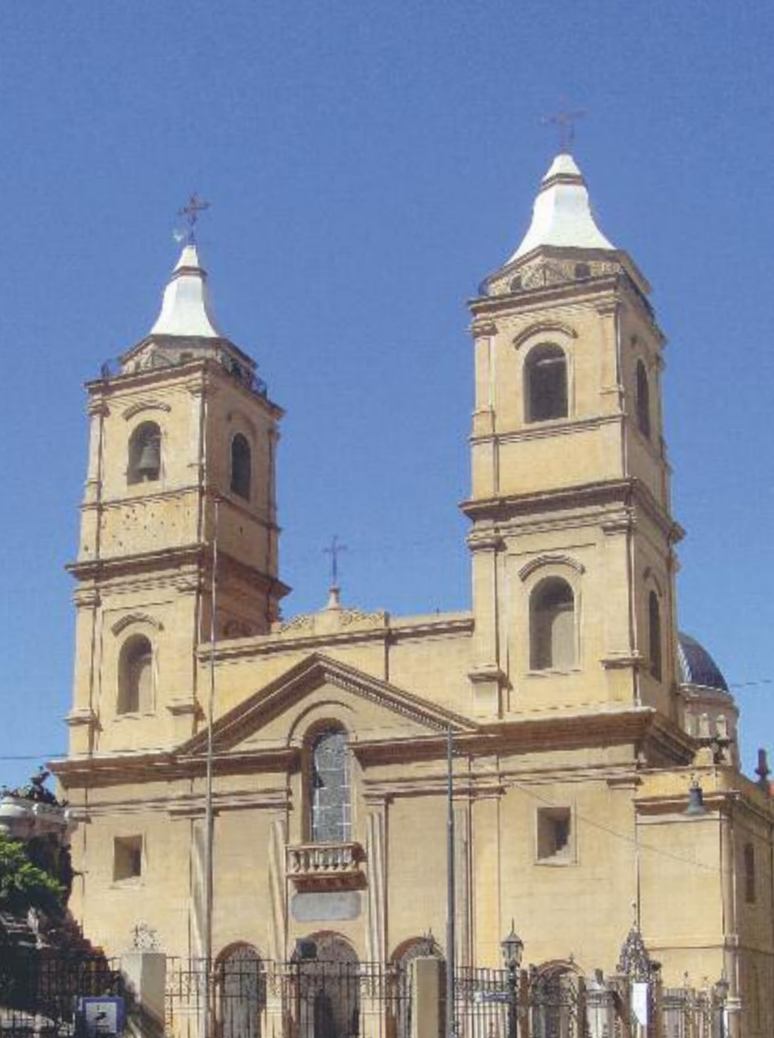
Facciata frontale, con doppio campanile, della Basilica de Nuestra Señora del Rosario, di fronte il Mausoleo di Manuel Belgrano.