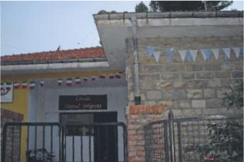
La sede del Circolo Manuel Belgrano a Costa d'Oneglia.