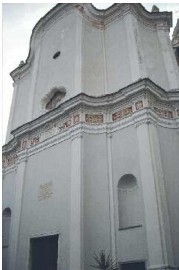
Facciata frontale della Chiesa parrocchiale di Sant'Antonio, Costa d'Oneglia.