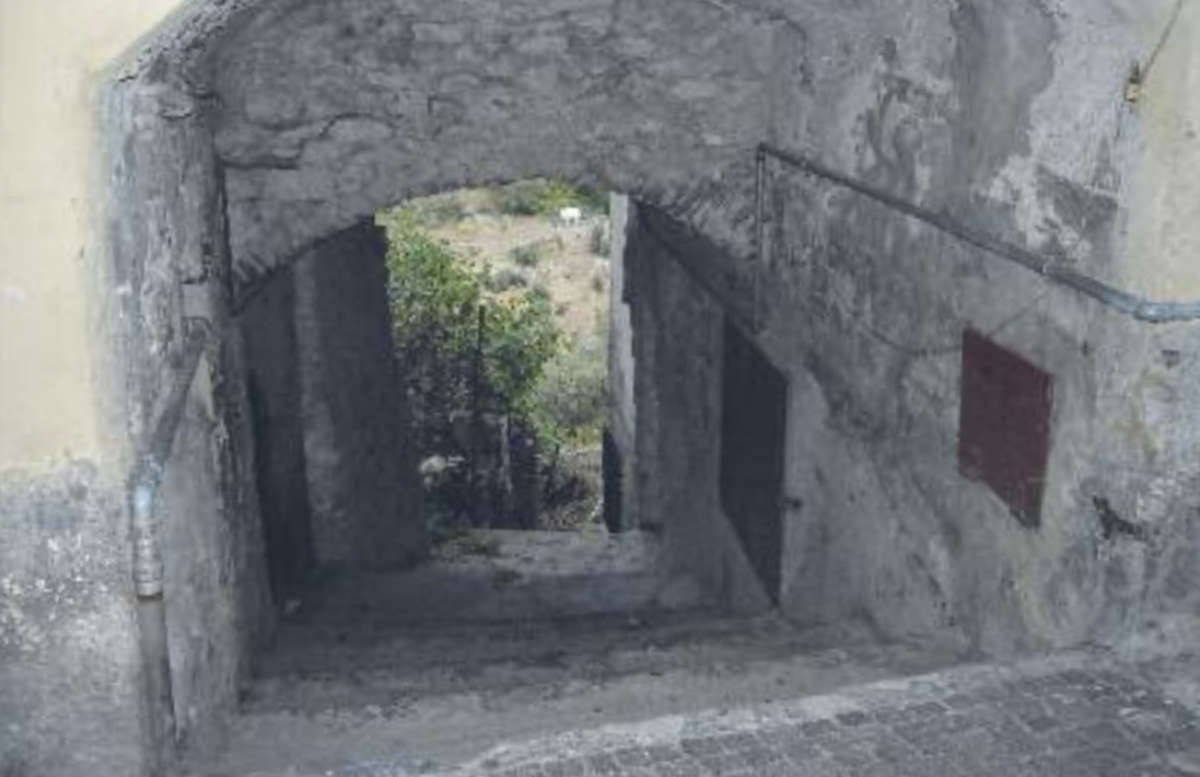
Scorci di Costa d'Oneglia.