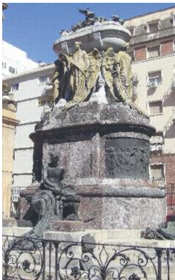
Mausoleo di Manuel Belgrano di fronte l'atrio della Basilica de Nuestra Señora del Rosario, vicino al Convento di Santo Domingo.