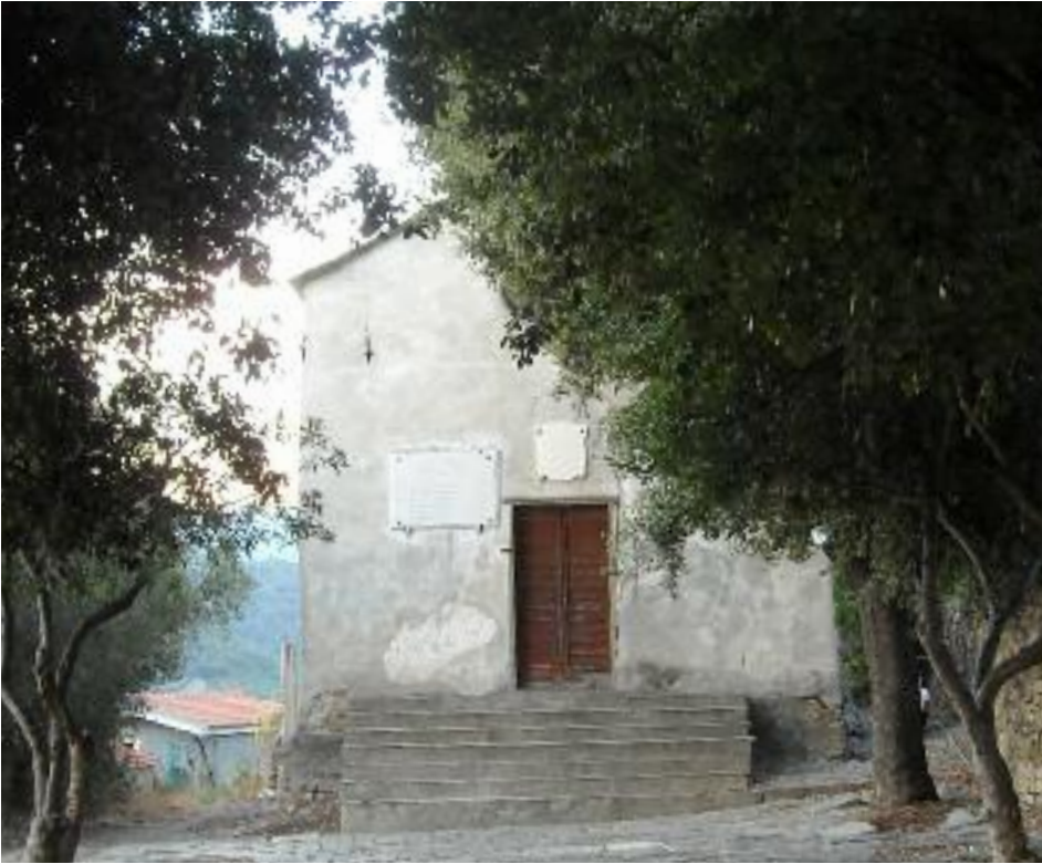
Chiesetta di San Sebastiano, Costa d'Oneglia.