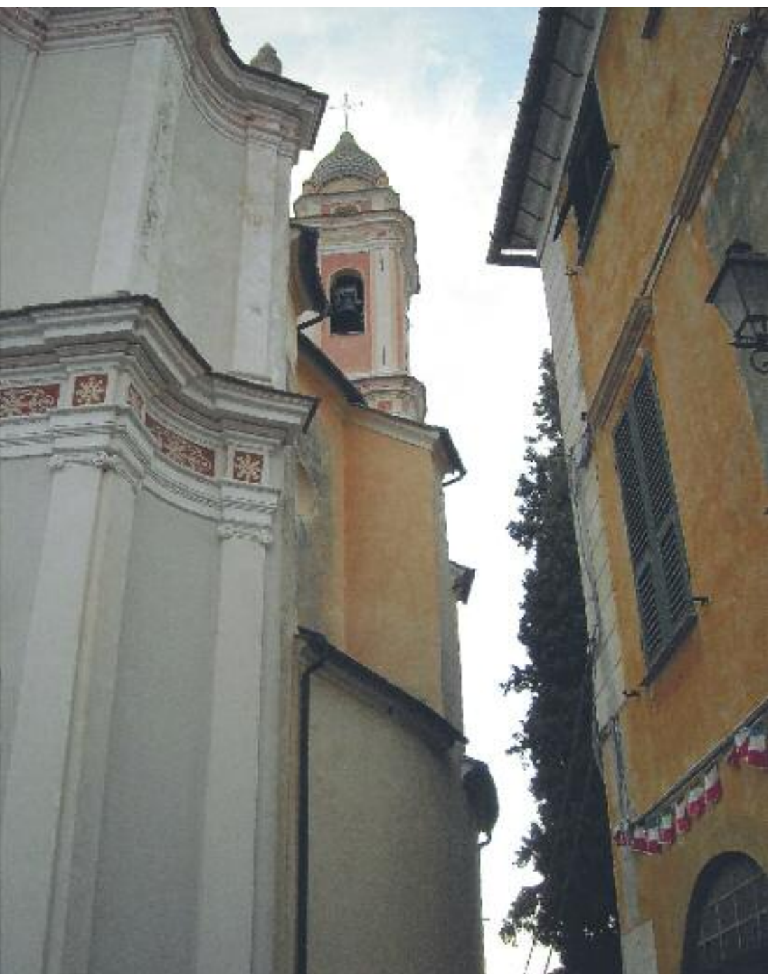
Scorcio della Chiesa parrocchiale di Sant'Antonio con campanile.