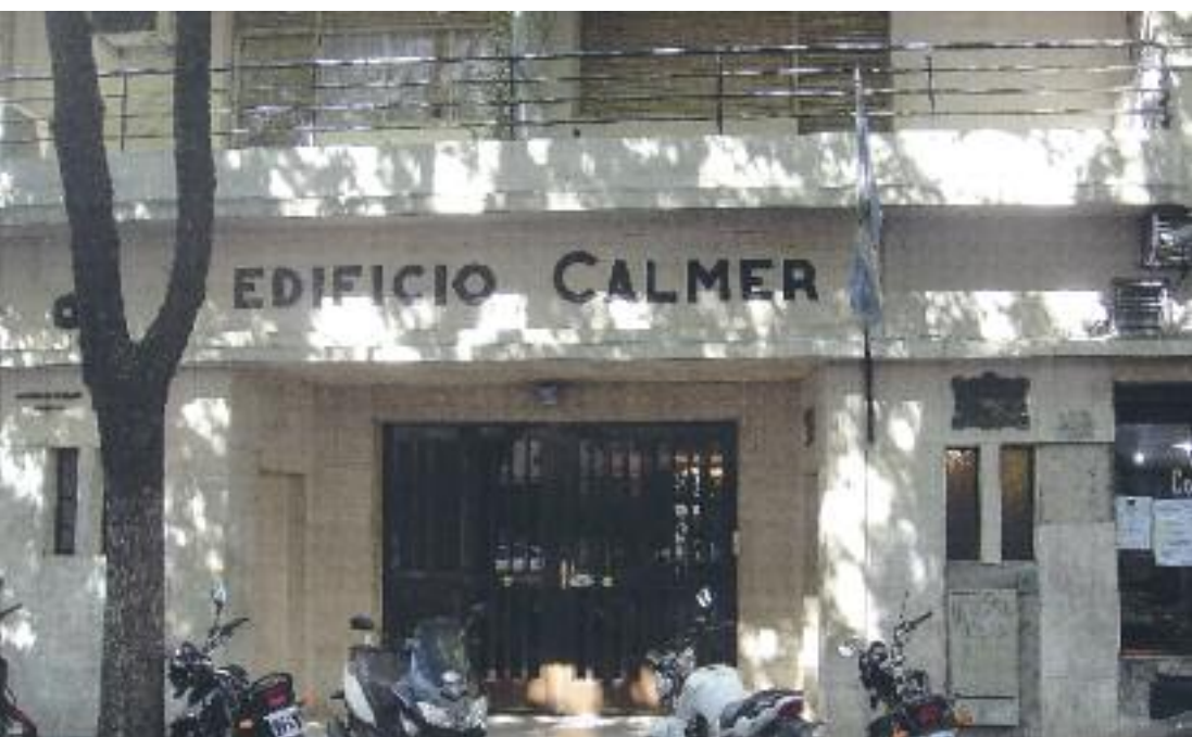
Edificio Calmer, ubicato in Avenida Belgrano. Alla sua posizione corrisponde quella della casa natale di Manuel Belgrano.