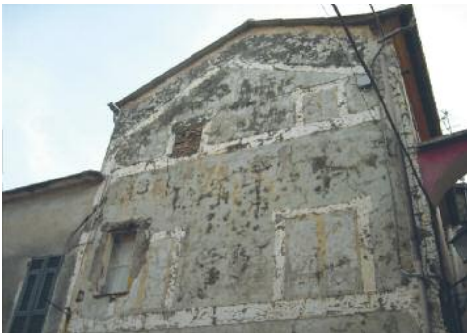
Fiction in Costa d'Oneglia.