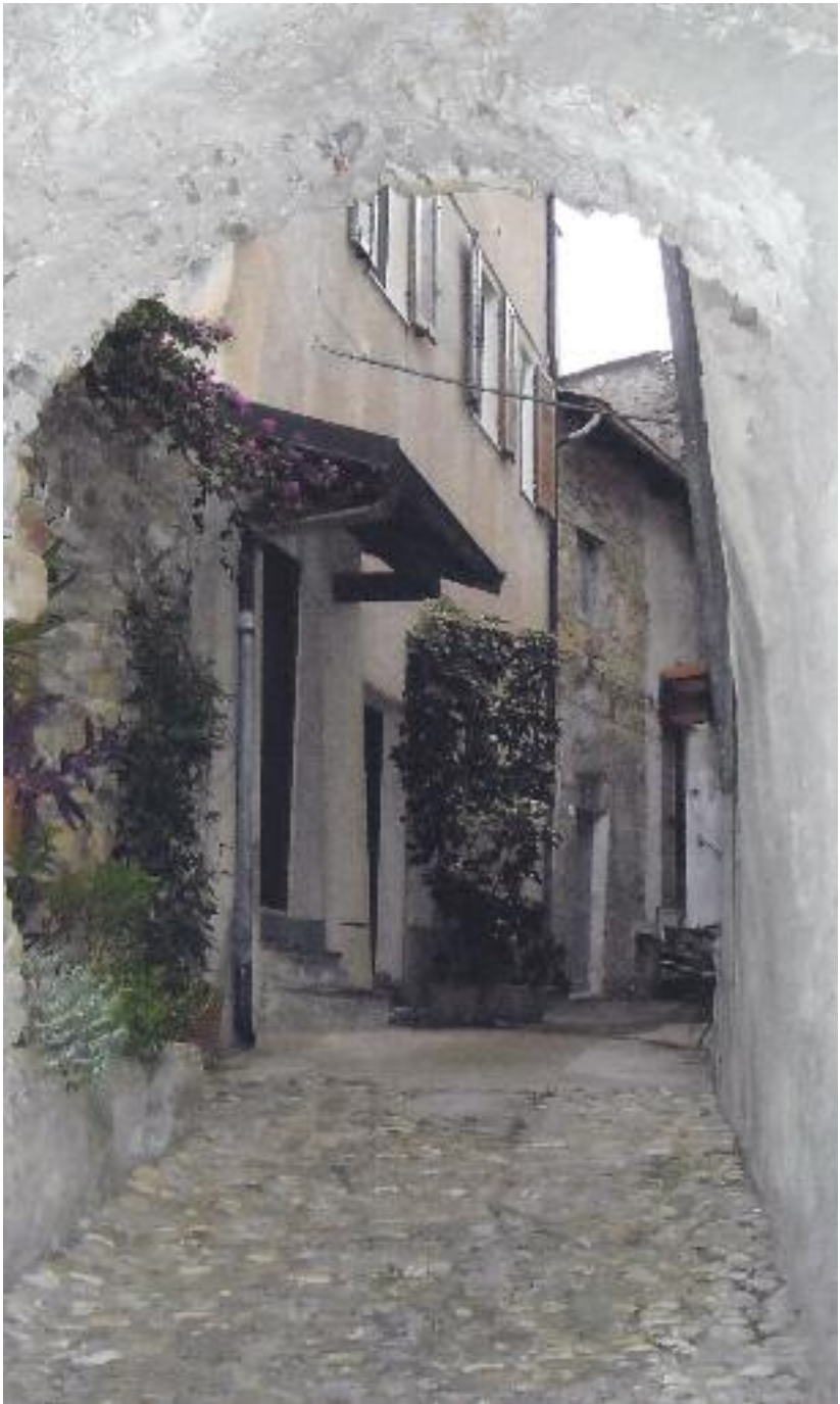
Scorcio di Costa d'Oneglia.